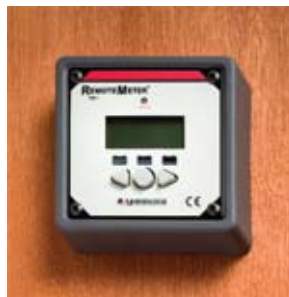
Montaje con marco