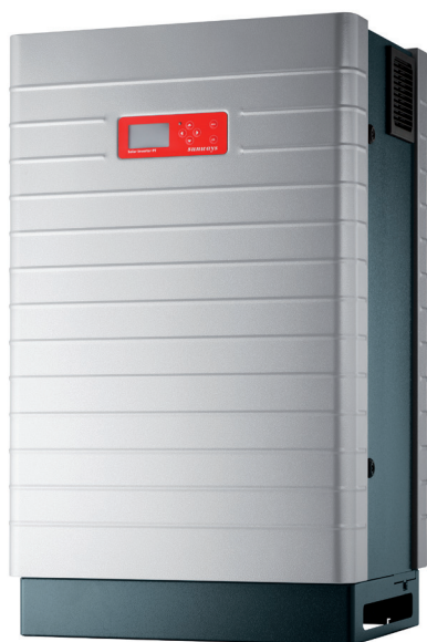
IP 42/ IP 54