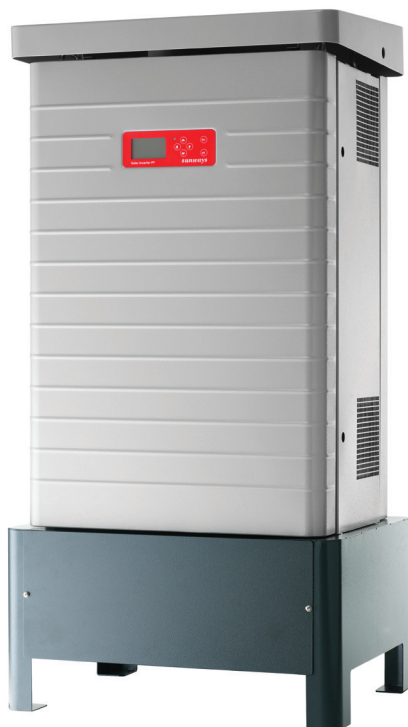
IP 55/ Outdoor