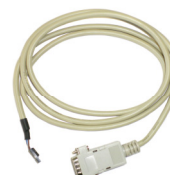
BMV-602 Data Link

El panel Blue Power para VE.Net es el que se conecta al controlador de baterías VE.Net. El panel puede mostrar la información de varias baterías en una sola pantalla, para una supervisión más sencilla y eficaz de sus sistemas de baterías. Para consultas sobre otros productos VE.Net, consulte nuestra hoja de datos de VE.Net.