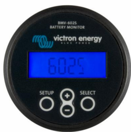
BMV 602S Black

Los modelos BMV disponen de un protocolo muy sencillo que puede utilizarse para su integración en otros sistemas.