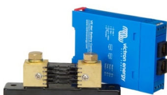
Ejemplo de una curva de carga de batería registrada con un BMV 602 y software VEBat

No necesita precontador. Nota: Los conectores RJ45 están galvánicamente aislados del controlador y del derivador.