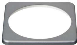
BMV bezel square