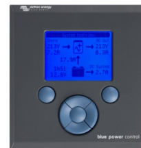
Tableau Blue Power

Kit de câble requis pour connecter le BMV et le Contrôle à distance Victron. Connexion des données BMV incluse.