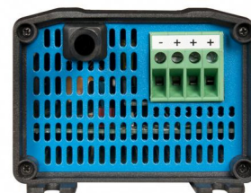
Model with 3 DC outputs