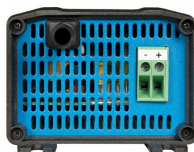
Model with 1 DC output